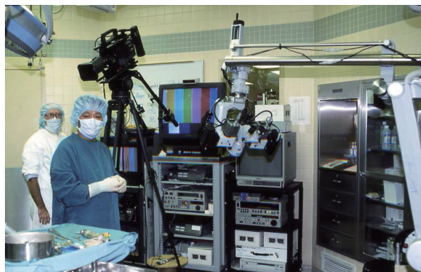
3DカメラLKシリーズ：アームに2台の小型カメラヘッド(銀色)を搭載

*福島式鍵穴手術とは脳外科手術に必要な開頭の範囲を最小限にとどめ、患者様の身体的な負担とリスクをおさえる術式です。