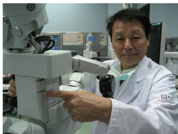
手術用顕微鏡にMKC-500HDを搭載