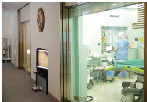
ガラス張りの手術室。 ご家族は外のモニターでスタッフから手術の状況について説明を受ける。

平成19年に池上のカメラを導入して活用してきました。今回、2室ある手術室のカメラを更新して感じたのは、従来のSDからHDに変わって画質が良くなったのは当然なのですが、その感度に驚きました。眼科治療は患者さんの眩しさへの負担を考えます。強い光は避けなければならないので、自ずと暗い環境で手術を行なうこととなります。そうすると、スタッフはモニターを見てもよく見えないのです。ですが、今回のカメラは感度が違う。スタッフも何をしているか、はっきり判りし、鮮明に記録できる。当然、手術室の外で見守るご家族がご覧になっているモニターにも手術の様子がくっきり映っているのでスタッフの説明も判り易いと評判です。「色」ということでは、池上の映像は自然な色。昔、他社のカメラを使用したことがあるのですが、一見、華やかなのですが、色のりが多すぎる感がありました。自然な色は、疲れのないのです。他の医療機器もそうなのですが、カメラの進歩も凄いですね。昔の医療用HDカメラはととても大きかった。今は、これほど小型化されて、明るさ、画質ともに申し分ない。技術はどんどん進歩していくと思いますが、現場を知り尽くしている池上は医療ニーズに応え業界をリードし続けて欲しいと思います。