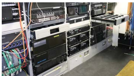
中継車内に架設された機器