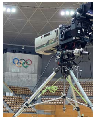
スポーツ中継で運用中の「HDK-X500」

今回導入した「HDK-X500」5 式は、番組制作や中継で運用しています。スポーツ中継で使うことが多いですね。主に中継車に搭載して運用します。長野では 1998 に冬季世界大会が開催されていますが、その施設を使ったスケート等の大会には中継車を出して中継します。「春の高校バレー」として注目される全日本バレーボール高等学校選手権大会の長野県大会の中継で、今回導入したカメラが大活躍しました。南北に長い長野県なので、中継車で広くカバーしています。毎年春の信州・伊那路を舞台に開かれる「春の高校伊那駅伝」の中継にも使用する予定です。自局の番組だけではなく、プロダクションへ貸し出す形で稼働することもあります。