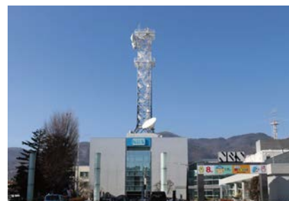
株式会社長野放送様公式サイト HP URL : https://www.nbs-tv.co.jp/