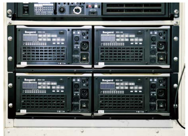
中継車に搭載された「BSX-100」

ベースステーション「BSX-100」は、他のモデルとの接続も可能になるマルチ仕様にしてもらいました。オプションでしたが、4Kモデルである「UHK-X700」を他局から借用した際に当社のベースステーションをそのまま使えるようにするためです。ここ2年くらい長野のテレビ局同士で機材の貸し借りを有償で行えるようにしています。他局でも技術的には助け合おうという気運があります。なかなか放送市場も厳しいので、特に地方局はそうやって助け合っていかなければと思っています。長野では、池上製カメラを使用する局と他社製を使用する局が半々だったのですが、当社が池上製カメラを導入したことで、貸し借りしやすくなったことは大きな意味があったと思います。