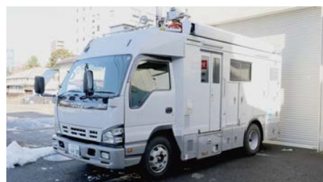
長野放送様で稼働中の中継車

今後の保守にも期待しています。カメラは初めての導入ですが、中継車や SNG 車は池上製ですしスイッチャー等のシステム機器も池上製を使用しています。機材更新もして長年運用していますが、壊れないですし不具合なく動いているので信頼しています。サッカーの中継でトランジションワイプを動画の CG で行うことになった時など、コンパクトスイッチャー「CSS-400」の使い方を丁寧に教えていただき、すぐ助かったことを覚えています。同じくスイッチャー「HSS-300」も本当に長い間使っていて、大きな中継車から外して可搬ラックでも使いました。予算の都合で、池上さんから機材だけ購入させていただき、自社でラッキングしセットアップもしましたが、アークネットの組み方など親切なアドバイスをいただきました。直接エンジニアの方ともやりとりさせていただきましたが、回答の早さや、いろいろお願いしたことにも応えていただいた点にとっても満足しています。信頼できるエンジニアさんがいらっしゃるの嬉しいですね。こうしたサポートの良さは池上さんの強みになっていると思います。