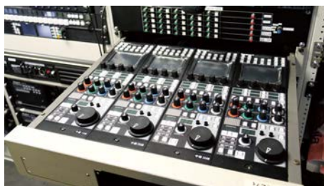
中継車内に設置された「OCP-300」