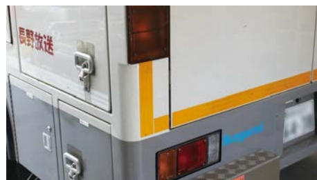
中継車の背面には Ikegami ロゴが表示されています