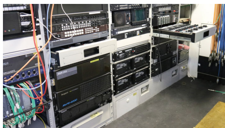
中継車内に架設された機器