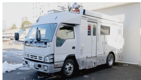
長野放送様で稼働中の中継車

今後の保守にも期待しています。カメラは初めての導入ですが、中継車や SNG 車は池上製ですしスイッチャー等のシステム機器も池上製を使用しています。機材更新もして長年運用していますが、壊れないですし不具合なく動いているので信頼しています。サッカーの中継でトランジションワイプを動画の CG で行うことになった時など、コンパクトスイッチャー「CSS-400」の使い方を丁寧に教えていただき、すごく助かったことを覚えています。同じくスイッチャー「HSS-300」も本当に長い間使っていて、大きな中継車から外して可搬ラックでも使いました。予算の都合で、池上さんから機材だけ購入させていただき、自社でラッキングしセットアップもしましたが、アークネットの組み方など親切なアドバイスをいただきました。直接エンジニアの方ともやりとりさせていただきましたが、回答の早さや、いろいろお願いしたことにも応えていただいた点にとっても満足しています。信頼できるエンジニアさんがいらっしゃるの嬉しいですね。こうしたサポートの良さは池上さんの強みになっていると思います。