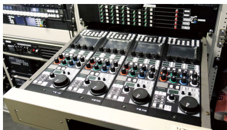
中継車内に設置された「OCP-300」