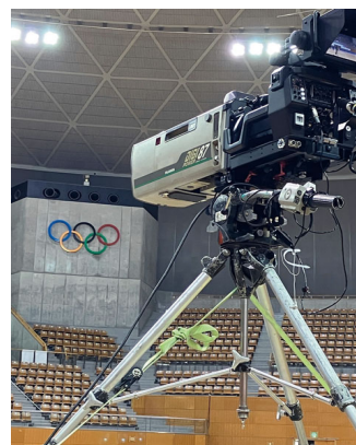
スポーツ中継で運用中の「HDK-X500」

今回導入した「HDK-X500」5 式は、番組制作や中継で運用しています。スポーツ中継で使うことが多いですね。主に中継車に搭載して運用します。長野では 1998 に冬季世界大会が開催されていますが、その施設を使ったスケート等の大会には中継車を出して中継します。「春の高校バレー」として注目される全日本バレーボール高等学校選手権大会の長野県大会の中継で、今回導入したカメラが大活躍しました。南北に長い長野県なので、中継車で広くカバーしています。毎年春の信州・伊那路を舞台に開かれる「春の高校伊那駅伝」の中継にも使用する予定です。自局の番組だけではなく、プロダクションへ貸し出す形で稼働することもあります。