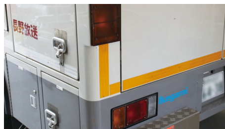
中継車の背面には Ikegami ロゴが表示されています