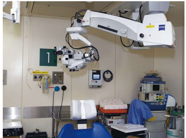
カメラを取付けた手術顕微鏡 (手術室1)

また、指導医が若手の手術をライブで見ながら、インカムを使って指導できるようにもしました。当院では、4つの手術室の映像を4階手術準備室のモニターにも映るようにしています。難しそうな箇所手術が差し掛かると指導医が助言をしていくので、すごく効率的です。映像がライブで瞬時に見られるということがすごく良いと感じています。