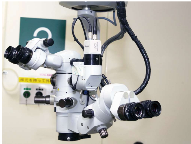
カメラを取付けた手術顕微鏡 (手術室2)