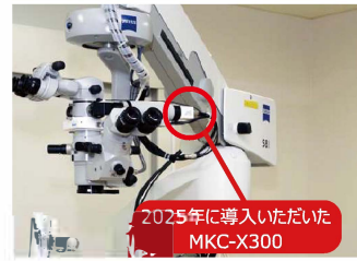
手術顕微鏡に取付けられたカメラ