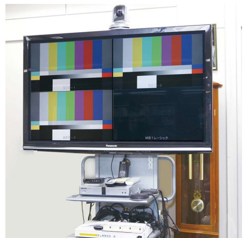
手術映像を隣接するビルの18階の医局まで伝送し、大型モニターに表示

離れた場所になりますが、医局でも手術映像をライブで見られるようにシステムを組んでいただきました。手術の進捗状況が離れていてもわかりますし、手術室まで行かずに手術映像を見られるので、勉強の機会が増えました。教育システムとしてもとても良い設備が導入できたと思っています。先生方も外来業務があり時間が決まっているので、ちょっと空いた時間で医局に来て手術を見られるのも効率的です。こうした要望は私からも出させていただきましたが、実際に離れた医局でも容易に見られるシステムを構築することができ大変満足しています。