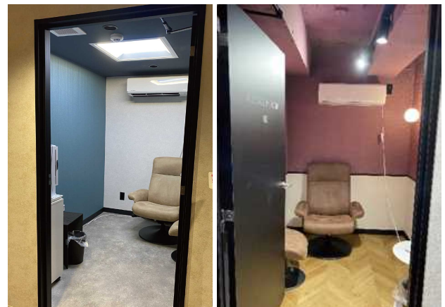
リラックスルーム

リラックスルームも二つ作りしました。休むところを個室にすることで術後の患者さんもリラックスしてくつろげます。このリラックスルームにはこだわりがあって、デジタル天板を設置しています。夕方になると部屋も夕焼けの中にいるような雰囲気になるなどよりリラックスしやすいように工夫しています。