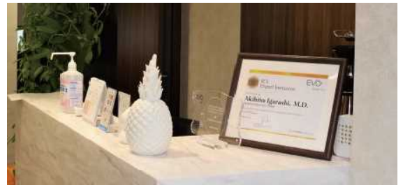
受付にはパイナップルのインテリアとライセンス証

パイナップルは、一説によるとホスピタリティーの象徴になっているそうです。ITを活用してもっとホスピタリティーを促進させようということから、パイナップルの中を電波が飛んでいるイメージを形にしたロゴにしました。SNSでハッシュタグを付けやすい、患者さんがその口コミをしやすいよう病院っぽさをなくして、「ここでICLやったよ！」って写真も撮ってくれたら嬉しいですね。そういうのをできやすくしました。