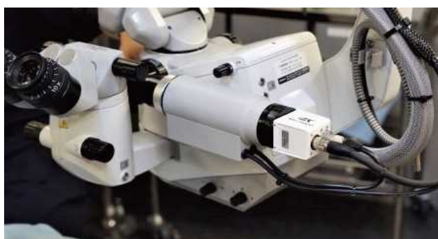
高感度4K出力カメラ MKC-704KHD

当院はカルテを全てクラウド管理しており、例えば患者様がこういう写真を見せてください、情報開示してくださいと要望されたときに、クラウドに取り込んだ静止画をSNSに送ることもできますが、電子ベースで送ると圧縮するため撮影するカメラ自体の画質差がかなりでできます。ここがIkegamiカメラのとてもよいところです。