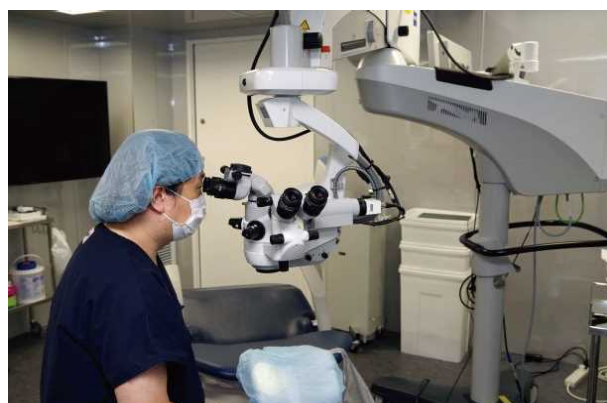
手術顕微鏡に取付けたMKC-704KHD

ICLは、我々がいろいろな世界に新しい技術や手術方法などを発信・発表できる手術ですが、その中で信頼性を得るためにはやっぱりカメラ映像がきれいなことがとても重要です。また、患者さんは若い方が多いため手術顕微鏡から目にあてる光量をできるだけ落としてフィルターをかけて、とにかく患者さんの目に優しい感じで手術をします。その低照度（弱い光）の中でもIkegamiのカメラはかなりきれいに映るので、そこが大きなメリットです。また眼内コンタクトレンズは非常に透明で薄いレンズですが、Ikegamiのカメラは解像度も高いので、カメラで撮った時に、わかりやすく映るのがよかったです。