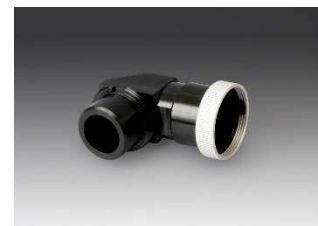
L型延長チューブ(オプション) 手術顕微鏡と干渉する場合に使用します