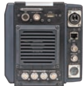
UHL-43后面板, 含12G-OPT选件和4x3G-SDI输出选件