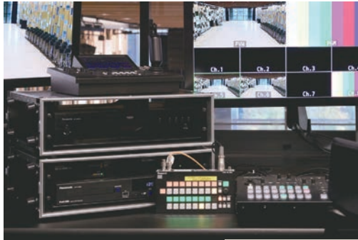
カメラ切替スイッチ CTRL 16L BOX

コントロールブースにあるルータリモコンから、光ネットワークで舞台下手袖の映像マトリクスルータをリモート制御し、8系統の4K映像ソースをプロジェクトをはじめとする出力先へ送出します。