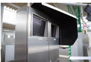
車両出入口の状況をチェックするモニタ架台