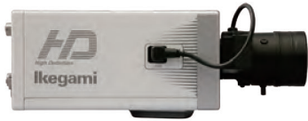
ISD-220HD 高感度フルHDカメラ