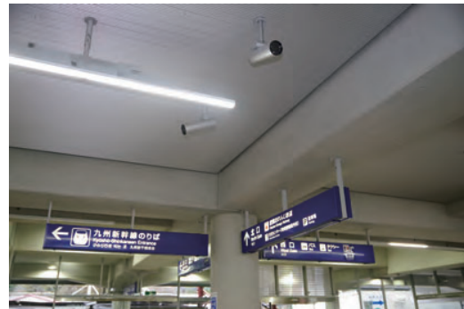
改札ロビーにもカメラを設置し、乗降客の安全を見守っています。