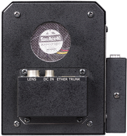
カメラヘッドのリアパネル